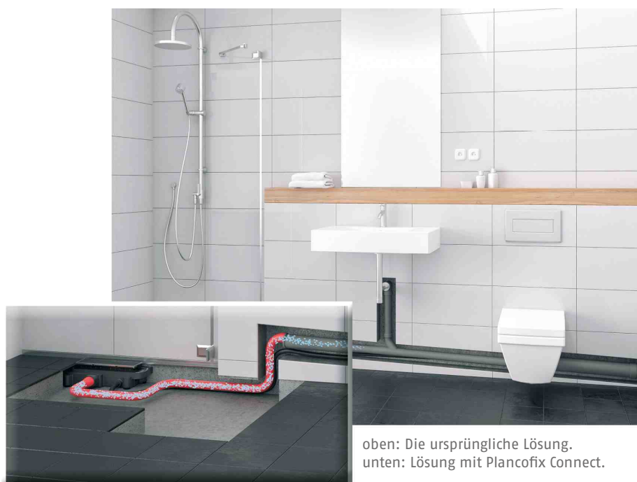
oben: Die ursprüngliche Lösung. unten: Lösung mit Plancofix Connect.

Jung Pumpen besetzt seit nahezu 100 Jahren den Bereich zuverlässiger Abwassertechnologie und hat mit der Produktmarke Plancofix eine mehrfach ausgezeichnete Bodenablaufpumpe am Markt. Die qualitativ hochwertigen HL-Duschrinnen mit passgenauer Verarbeitung und anerkanntem Design gehören seit Jahrzehnten zur Ausstattung anspruchsvoller Bäder.