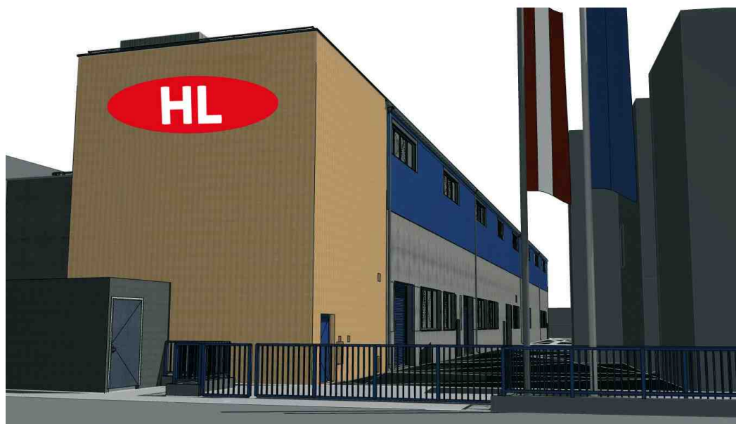
Im November erfolgt die Eröffnung der neuen Werkshalle.

Beide Unternehmen vertreiben ihre Produkte unabhängig voneinander über den SHK-Großhandel. Jung Pumpen liefert den Plancofix Connect samt Dichtmanschette, welche für die fachgerechte Ausführung der Verbundabdichtung erforderlich ist.