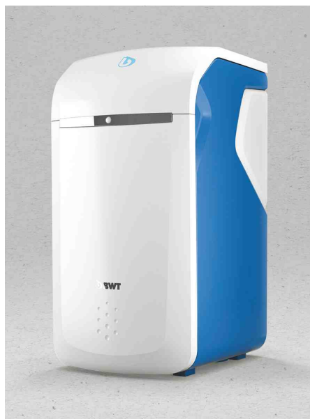
BWT Perla home

Für alle, die das Besondere suchen, wurden beim BWT Perla home alle modernen Features des BWT Perla in dem preisgekrönten Chassis belassen. Darüber hinaus sind die gleichen Dienstleistungs- und Garantieoptionen erhältlich. Im Sinne der Wirtschaftlichkeit wurde jedoch auf die Bauform einer Simplex-Anlage gesetzt. Damit hebt der BWT Perla home die Produktkategorie der Einsäulen-Perlwasseranlagen auf ein neues Level und schafft ein neues Angebot: Während die Duplex-Anlage BWT Perla mit einer höheren Durchflussleistung von bis zu 53 l/min und einer 24/7 Perlwasser-Versorgung punktet, stechen beim BWT Perla home die absolut gleichwertige Ausstattung, der erschwingliche Anschaffungspreis und eine vielfach ausreichende Leistungsfähigkeit hervor. Dank vorausschauendem Hygiene-Betrieb ergibt sich auch eine hohe Versorgungssicherheit und eine für viele Privat-anwendungen gut geeignete Leistung von 30 l/min.